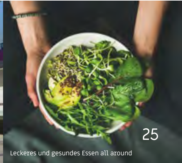
Leckeres und gesundes Essen all around