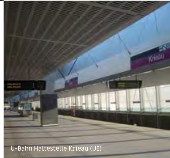
U-Bahn Haltestelle Krieau (U2)